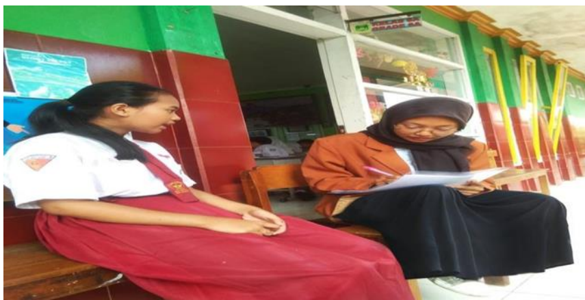
Gambar 3. Wawancara Siswa