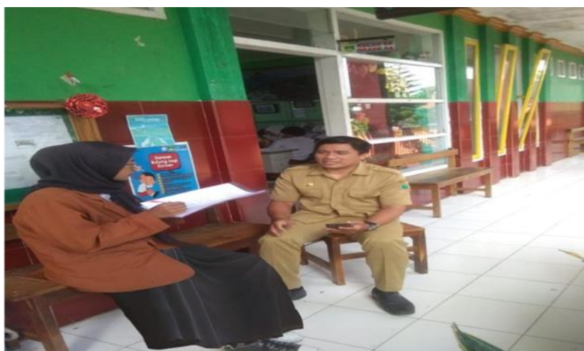
Gambar 2. Wawancara guru